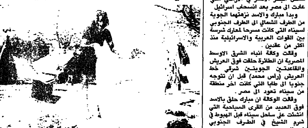
امرأة اسرائيلية من العائلات المشردة داخل احد المخيمات (ا ف ب)

اعلن مسؤول في الهجرة واعضاء بارزون من طلائع الفالاشا اسس ان تدقيق اليهود الاثيوبيين في اسرائيل، والذي يخلفه ستار من السرية قد توقف فجأة وقالوا ان ١١٠٠٠ يهودي اسود غادروا المناطق المنكحة بالحروب في اثيوبيا، وتجنصوا في العاصمة اميس ابايا في انتظار التصريح لهم بالخروج، وذلك في ظروف سيئة وامراض متفشية.